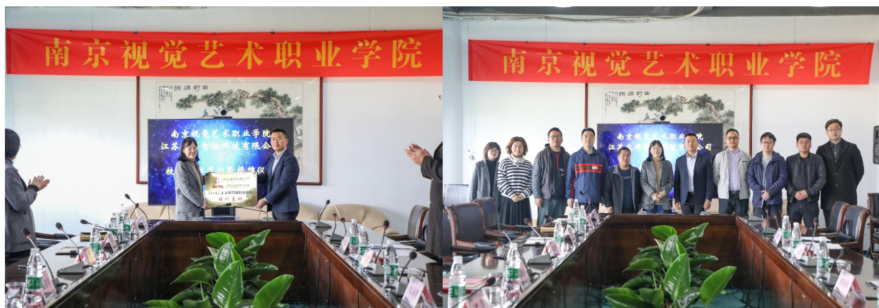
图 17 我院与江苏众硕智绘科技有限公司就无人机培训签订双方合作协议

此次合作代表着我院与江苏众硕智绘科技有限公司将致力于发展高等职业技术教育，积极推行校企合作、工学结合的人才培养模式，提高职业教育教学质量，为社会输送高素质、高技能的高端专门人才。