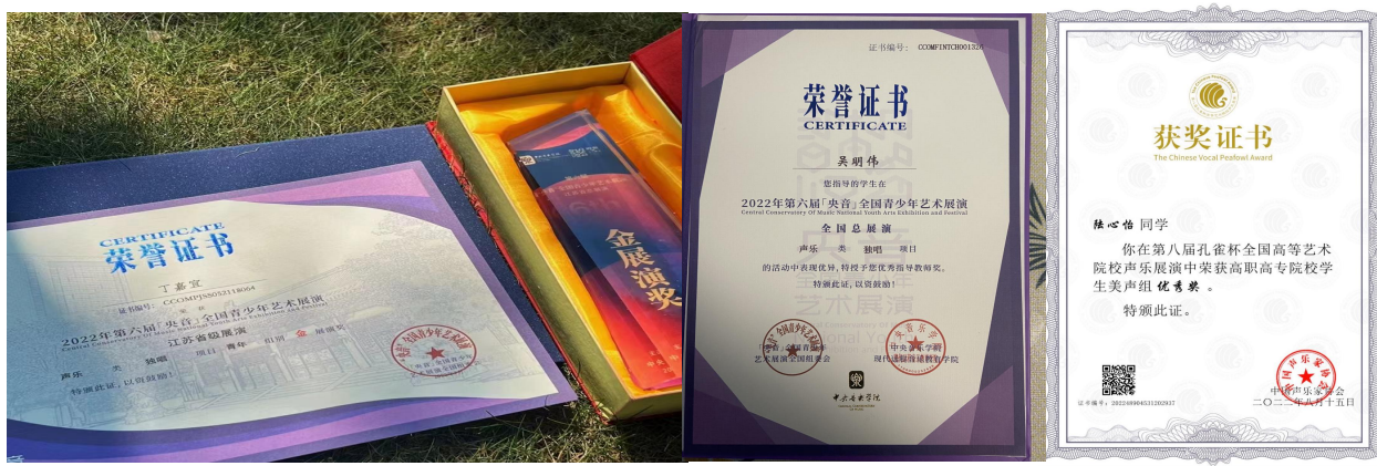
图 21 我院在第六届“央音”全国青少年艺术展演、第八届孔雀杯全国高等艺术院校声乐展演中荣获多个奖项

第六届“央音”全国青少年艺术展演，第八届孔雀杯全国高等艺术院校声乐展演是 2022 年春季开启的两项国家级艺术类竞赛，两场赛事全国共计 1000 余所高校参与，总计展演 36 余场，我院共派出二十余组师生参与。参赛作品经校赛、预赛、省级初赛、省级复赛，我院师音乐系教研室主任王玉玺，声乐专任教师冯乐韵，李文，孙倩，张子年；器乐专任教师田雨薇，王书冉等获优秀指导老师奖。声乐表演青年组丁嘉宜，胡益鸣，孙佳怡，孔海颖，王秋妍；钢琴表演青年组陈子来，钱橙，薛程瑶，仇昕瑞，许吴杰等共 17 名学生摘得该赛金银奖项。20 级音乐表演学生陆心怡摘得“第八届孔雀杯高职美声组”“优秀奖”。