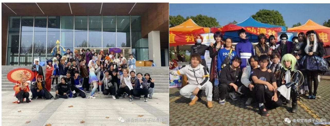
图 12 “雨孩子动漫社” 活动